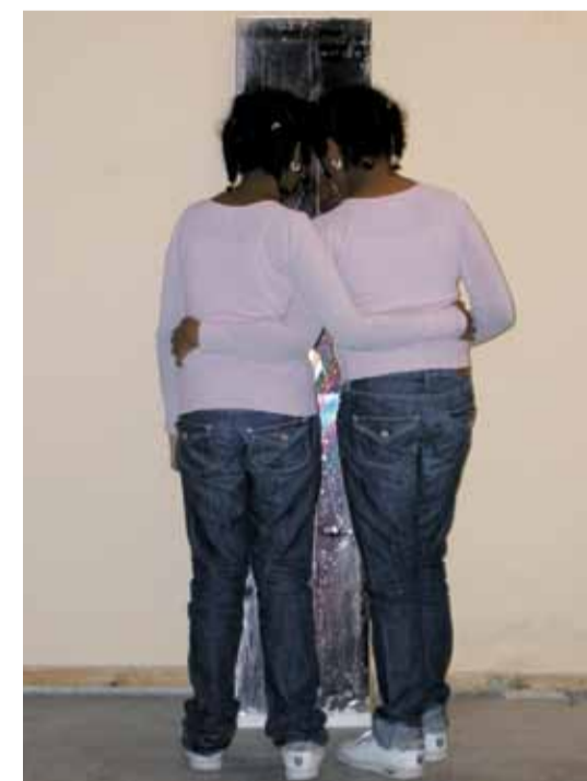
Twee jonge deelnemers aan de masterclass zang bereiden zich voor.

Het toneelstuk wordt 13 februari om 20.00 uur opgevoerd vanuit de Proefplek, Mathenesserdijk 387B. Nieuwsgierig geworden? Kijk voor meer informatie op www.Proefdebuurt.nl of bel naar: 010 - 477 73 61.