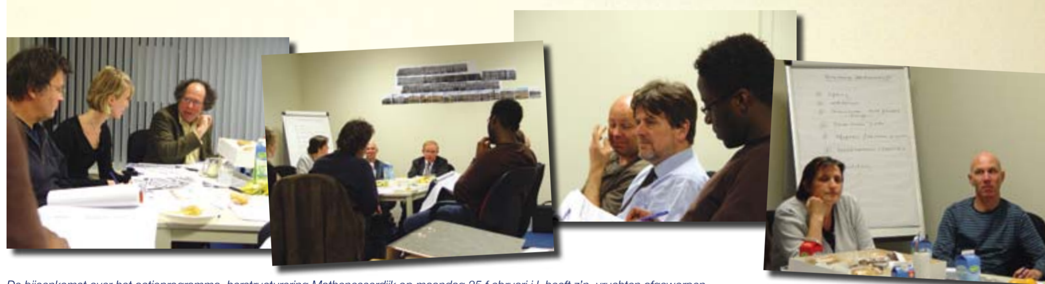
De bijeenkomst over het actieprogramma herstructurering Mathenesserdijk op maandag 25 februari j.l. heeft z'n vruchten afgeworpen. Een groot deel van de partijen, betrokken bij de herstructurering van de Mathenesserdijk, was aanwezig.